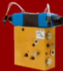
Ab 7.500 €