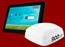
XCN 1050, RTK Freischaltung, NAV900